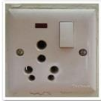
เต้าเสียบ

ปลั๊กไฟที่เนपालเป็นแบบสามรูหัวกลมไฟ 220 โวลท์